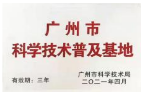
图 B.7 科普基地认定牌示例