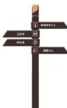
图 B.5 图形符号和文字组成的服务设施导向牌示例