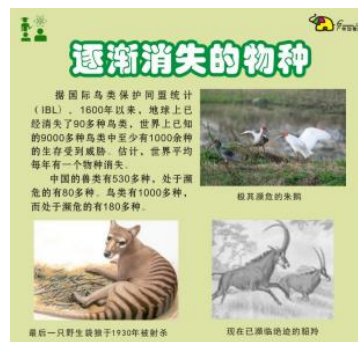
图 B.12 科普解说牌示例