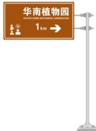
图 B.2 外部导向牌设置示例