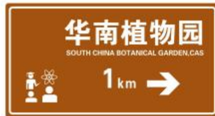
图 B.1 外部导向牌设计示例