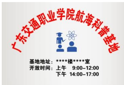
图 B.8 科普基地运行牌