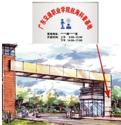
图 B.9 科普基地运行牌设置示例