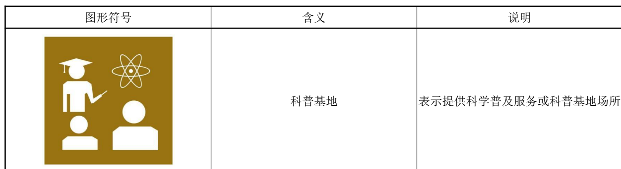
表 A.1 科普基地图形符号

A.2.4 一大一小人物图标 代表了参加科普活动的人员，既代表亲子家庭，也代表学生和成人两大类科普对象。