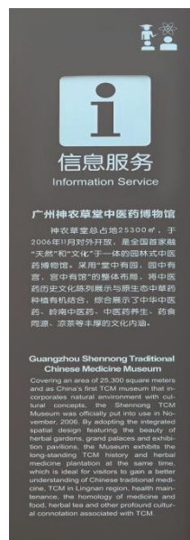
图 B.10 科普基地信息牌示例