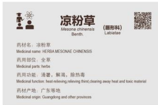
图 B.11 展品展项标注牌示例